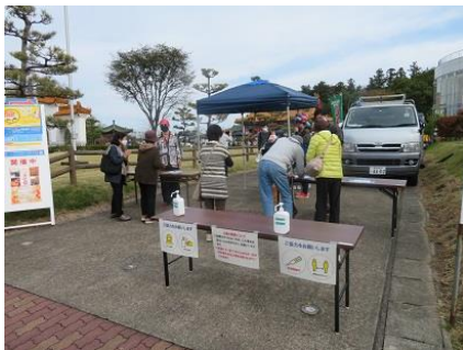
【写真】新型コロナ対策で初めて設置されたふるさと館入口の受付場

まだまだ安心できない状況ですが、今後も引き続き、みなさんからのご協力が必要になりますので、よろしくお祈りします。