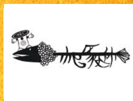
The 区役所 (12:35~)