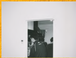
You tan posterr (9:00~)

長岡技術科学大学と新潟県内の大学の学生たちが(長岡造形大学、新潟国際情報大学、新潟大学)協力して企画運営をする音楽イベント